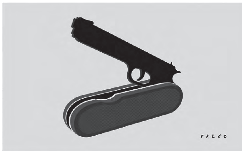
Dieses Sackmesser gehört zugeklappt. Karikatur: Falco/Juventud Rebelde

«Die Initiative leistet einen Beitrag zu einer friedlicheren Welt», schreibt das Bündnis. «Waffen sind kein Produkt wie jedes andere. Sie werden hergestellt, um Menschen zu töten. Möglichst viele, möglichst effizient.