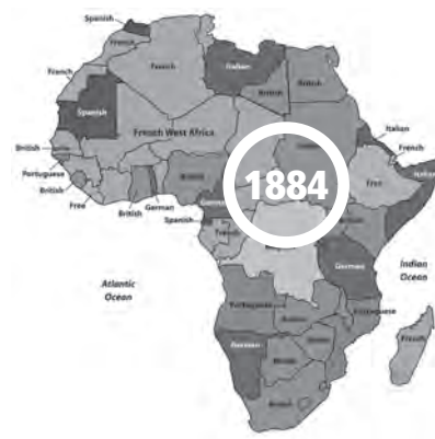
Die Kolonien in Afrika 1884 und 2017: Eine verbleibt.... Grafik UW

Wie die Südafrikaner einst unter der Apartheid litten, leiden wir heute noch in den besetzten Zonen der Westsahara unter willkürlichen Verhaftungen; friedliche Demonstrationen sind verboten und wenn sie dennoch stattfinden, werden sie gewaltsam unterdrückt; rund 50 politische Gefangene sitzen in marokkanischen Gefängnissen, und viele von ihnen wurden, obwohl sie Zivilisten sind oder Studenten, von marokkanischen Militärgerichten verurteilt. Das marokkani-