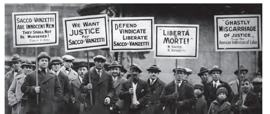
Millionen von Menschen in den USA und in aller Welt protestierten gegen das Todesurteil.

Quelle: Carl von Ossietzky, Reichenschaft, Fischer Taschenbuch Verlag, 1972