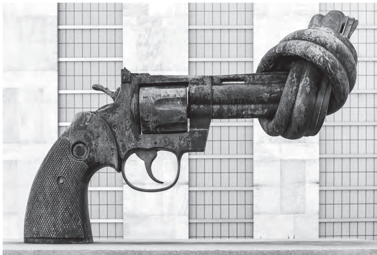
«Non-Violenc» – Gewaltlosigkeit: Die Skulptur des Schweden Carl Frederik Reuterswärd wurde der UNO 1988 von Luxemburg geschenkt und steht vor dem UNO-Hauptquartier in New York.