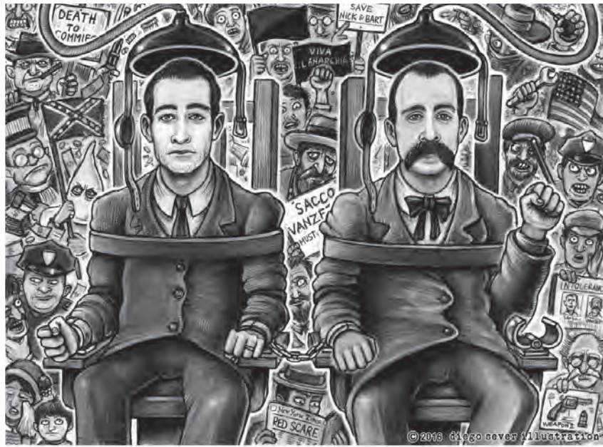
«Sacco und Vanzetti»: Ein Werk des italienischen Künstlers Diego Sever. Quelle: diegoeverillustration.com © Alle Rechte vorbehalten.