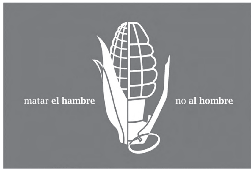
Den Hunger vernichten, nicht den Menschen: Plakat des kubanischen Grafikers Jorge Carlos Cintrón Suárez.