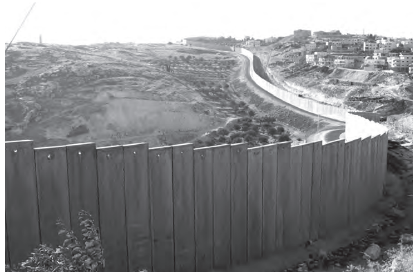
Die israelische Mauer quer durch Palästina zieht sich weit ins Westjordanland hinein.

Eines der Kernthemen des zurückgezogenen UN-Berichts ist die Einwanderungspolitik Israels als zentrales Werkzeug der Apartheid. Während es allen Juden dieser Welt – und deren Ehepartnern, ihren Kindern, Enkeln und all deren Ehepartnern – möglich ist, staatlich alimentiert nach Israel zu emigrieren, ist dies den im Zuge der israelischen Staatsgründung 1948 vertriebenen Palästinensern und de-