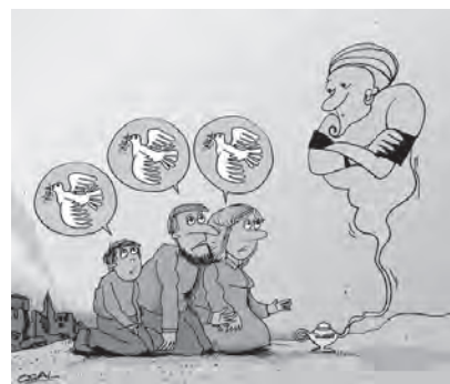
Drei Wünsche.

Kein Wunder deshalb, dass die Gesamtsumme der Rüstungskosten seit den Berichten von Fidel Castro und Willi Brandt noch einmal stark zugenommen hat. Laut SIPRI erreichte sie 2015 1,676 Billionen Dollar, was 2,3 Prozent des globalen Bruttoinlandsprodukts entspricht. Mit 600 Milliarden Dollar haben die USA ihren «America first»-Anspruch auch hier behauptet. «Wenn man den «Schattenetat» des Pentagon, die «Notfallgelder» für die Kriege im Irak und Afghanistan und andere verborgene