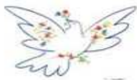
Asamblea del WPC 2008

Queridos amigos, compañeros de lucha por la paz y la justicia en el mundo